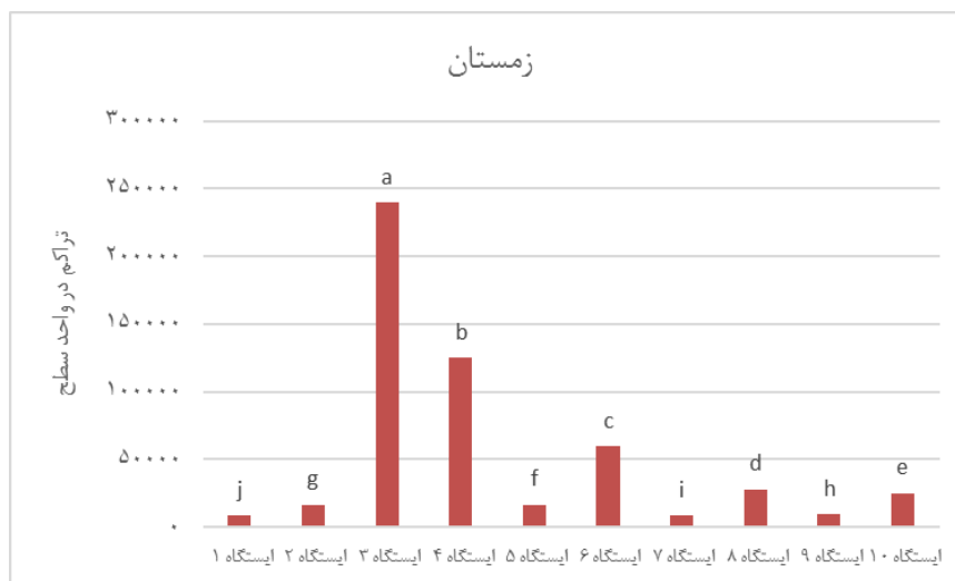
شکل ۴: تراکم درشت بی‌مهرگان کف زی در ایستگاه‌های مورد بررسی در خوریات خور موسی (تابستان و زمستان ۱۳۹۷).