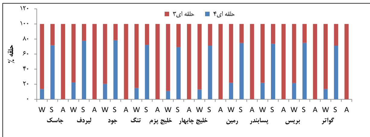
شکل ۳: الگوی پراکنش ترکیبات هیدروکربن‌های آروماتیک چند حلقه‌ای (۱۳۹۷).

بررسی الگوی پراکنش ترکیبات هیدروکربن‌های آروماتیک چند حلقه‌ای در نمونه‌های زیستی (جلبک) و غیر زیستی (رسوب و آب) بر اساس تعداد حلقه‌های بنزی نشان‌دهنده غالبیت ترکیبات چهار حلقه‌ای در جلبک و نمونه‌های رسوب از ایستگاه‌های مختلف نمونه‌برداری است. در نمونه‌های آب مربوط به ایستگاه‌های مختلف ترکیبات سه حلقه‌ای دارای غالبیت بودند (شکل ۳).