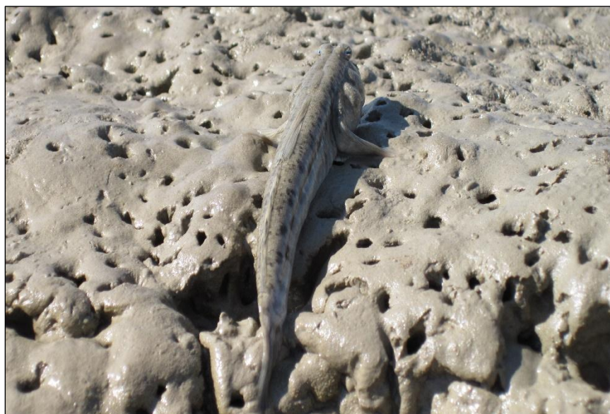
شکل ۱: عکس گل خورک در هنگام صید.

محدوده موردبررسی آب‌های ساحلی بندرعباس شامل منطقه تیاب در موقعیت جغرافیایی 27^{\circ}06' عرض شمالی و 56^{\circ}51' طول شرقی واقع در شرق بندرعباس و منطقه بندر خمیر 26^{\circ}56' عرض شمالی و 55^{\circ}36' طول شرقی واقع در غرب بندرعباس می‌باشد. عملیات نمونه‌برداری به‌صورت ماهانه از مرداد تا دی‌ماه ۱۳۸۷ و به روش صید دستی انجام گرفت. نمونه‌ها در فرمالین ۱۰ درصد فیکس و جهت عملیات زیست‌سنجی به آزمایشگاه منتقل شدند.