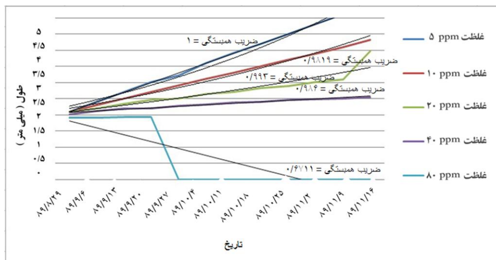
شکل ۱: طول کل بچه ماهیان دلقک ماهی کاذب ( Amphiprion ocellaris ) نسبت به تغییرات

تیمار شماره چهار فاقد اختلاف معنی دار با تیمار شماره سه است ( P > 0.05 )، اما دارای اختلاف معنی دار با