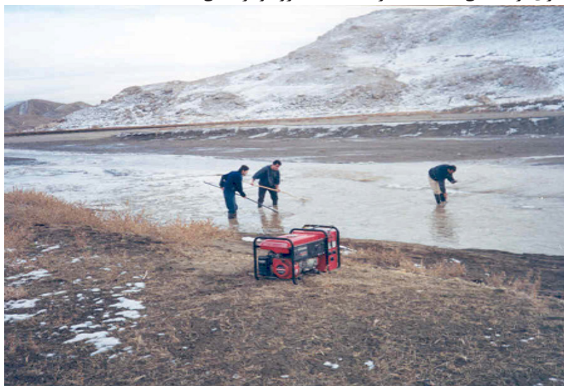
شکل ۱: نمونه برداری از ماهیان با دستگاه الکتروشوکر.

در شکل ۱، نمونه برداری از ماهیان با استفاده از دستگاه الکتروشوکر نشان داده شده است.