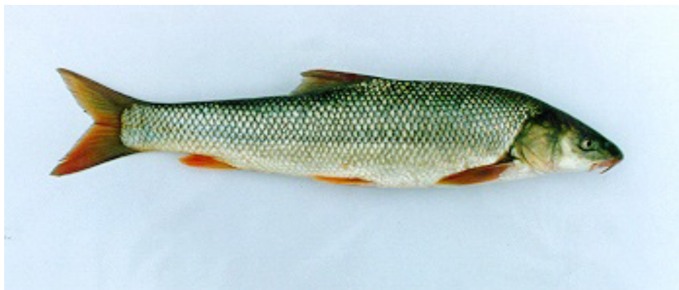
شکل ۴: گونه ( Luciobarbus capito (Güldenstaedt, 1773)