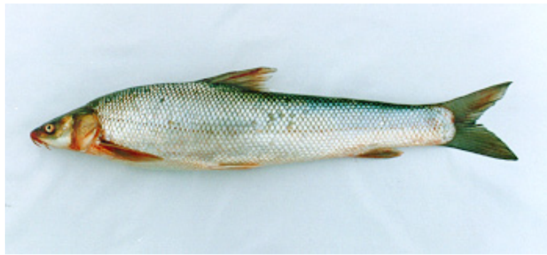
شکل ۳: سس ماهی گونه ( Luciobarbus brachycephalus (Kessler, 1872)