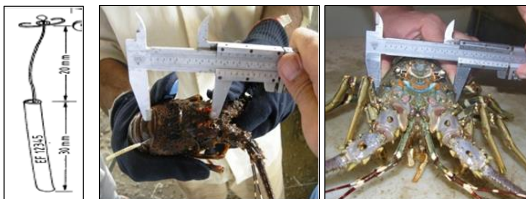
شکل ۲: تصویر سمت چپ، نشانه مخصوص نشانه‌گذاری لابستر و تصویر سمت راست، اندازه‌گیری طول و عرض کاراپاس لابستر ( Panulirus homarus ) نشانه‌گذاری شده با کولیس در شروع تحقیق در سال ۱۳۸۹.

لابسترها بر اساس طول کاراپاس به پنج کلاس طولی به شرح زیر تقسیم گردید: