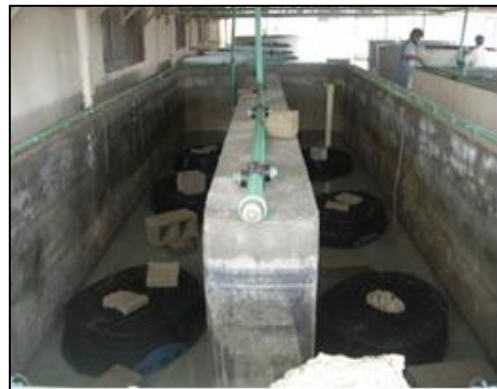
شکل ۱: استخر بتونی مورد استفاده در کارگاه تکثیر مرکز تحقیقات شیلات چابهار و جانمایی قفس‌های مربوط به تیمارهای لابستر خاردار ( Panulirus homarus ) در سال ۱۳۸۹.

کارایی دریچه خروج روی قفس از نظر جانمایی و اندازه دریچه به عنوان تیمارهای تحقیق و هر تیمار با ۳ تکرار در استخرهای بتونی به صورت ذیل مورد بررسی قرار گرفت: