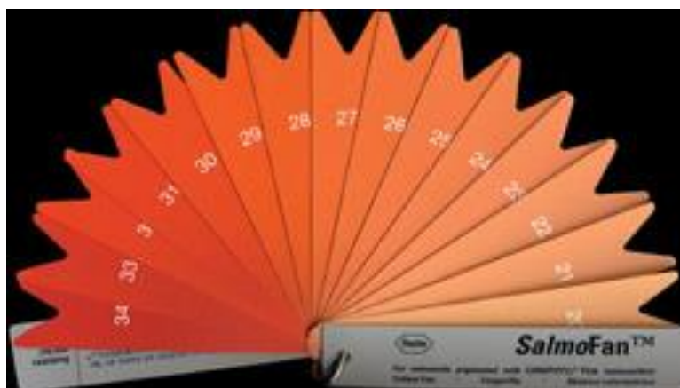
شکل ۱: SalmoFan™.

در طول دوره، هر ۱۴ روز یک‌بار کل ماهیان موجود در هر حوضچه مورد زیست‌سنجی قرار گرفته و پس از بیهوشی با استفاده از عصاره پودر گل میخک با دوز ۲۰۰ قیمت در میلیون (مهرابی، ۱۳۷۸)، طول آن‌ها با خط‌کش میلی‌متری و وزنشان به وسیله ترازوی دیجیتال با دقت ۰/۰۱ گرم اندازه‌گیری شد. همچنین هم‌زمان با هر مرحله زیست‌سنجی، رنگ گوشت ماهی‌ها نیز با استفاده از SalmoFan™ مورد ارزیابی قرار گرفت. این وسیله دارای ۱۵ نمونه رنگ می‌باشد که به ترتیب از اعداد ۲۰ تا ۳۴ شماره‌گذاری شده‌اند (شکل ۱). برای انجام این کار پس از جدا کردن پوست از بدن ۳ عدد ماهی در هر تکرار، از گوشت کنار دنده برای تطابق رنگ استفاده شد (Talebi et al., 2013). لازم به‌ذکر است ۱۲ ساعت قبل و بعد از زیست‌سنجی غذایی قطع می‌گردید.