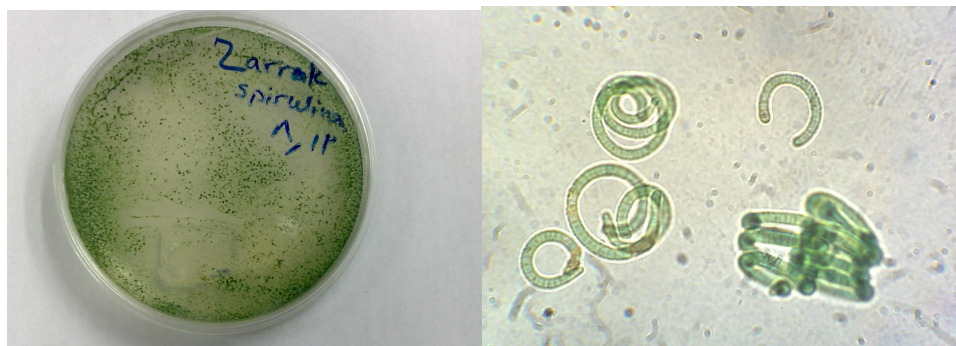
شکل ۴- اسپیرولینا در محیط کشت زاروک

طی دوره های مختلف جلبک زیر میکروسکوپ بررسی شد و حالت پلی مورفیسم به وضوح در آن قابل مشاهده بود که دلیل آن تغییرات فیزیکی (مثل دما، نور و غلظت محیط کشت) در محیط کشت می باشد. نتایج شمارش جلبکی در جدول ۴ و میزان رشد و تکثیر در جدول ۶ آورده شده است. در جداول دوره منظور زمانی است که اسپیرولینا حداکثر رشد را داشته و پس از آن برداشت شده است.