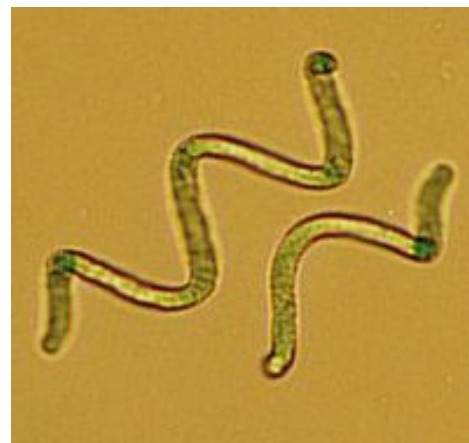
شکل ۱: اسپیرولینا

در ۲۰ سال اخیر اسپیرولینا بطور تجاری تولید شده است و به عنوان غذا مورد استفاده قرار میگیرد. جلبک های تجاری معمولا در استخرهای بزرگ در محیط بیرون تحت شرایط کنترل شده، تولید می شوند و بعضی از شرکت ها بطور مستقیم از تولید دریاچه استفاده می کنند (Belay, 2002). امروزه میزان تولید اسپیرولینا در جهان نزدیک به ۵۷۰۰۰ تن می رسد (FAO, 2006). فروش گسترده در فروشگاههای مواد غذایی و بهداشتی سلامت اسپیرولینا را تضمین کرده است و انسان قرنهایست که از آن استفاده کرده و در مطالعات بسیار گسترده سم شناسی مورد استفاده قرار میگیرد (Belay, 2002).