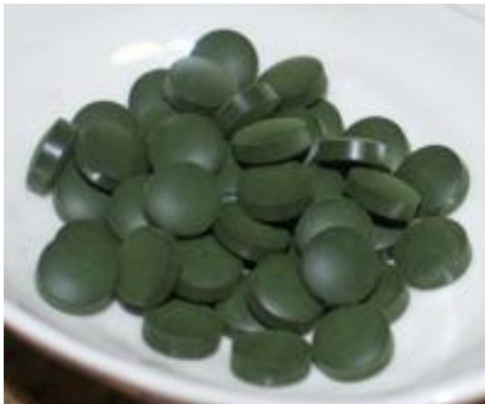
شکل ۲: قرص اسپیرولینا به عنوان مکمل غذایی

اسپیرولینا سیانوباکتر رشته ای میکروسکوپی می باشد و اسم این جلبک از شکل مارپیچی و رشته ای آن مشتق شده است (شکل ۱). گزارشهای متعددی وجود دارد که ۴۰۰ سال قبل آرتک ها در مکزیک از این جلبک ها به عنوان غذا استفاده می کردند. در حال حاضر در کشور چاد در اطراف دریاچه چاد قبیله کانمبو این جلبک را خشک کرده و به عنوان نان مصرف می کنند و به آن Dihe می گویند (Belay, 2002).