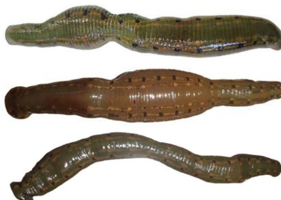
شکل ۲. زالوهای دفرمه شده پس از تغذیه