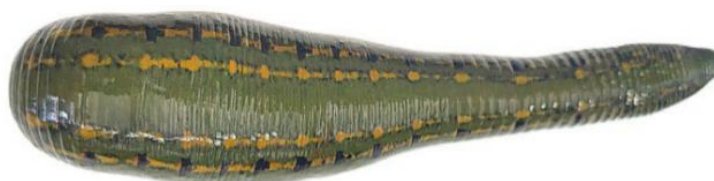
شکل ۱. زالوی شرقی

زالوی شرقی ( Hirudo orientalis ) یکی از گونه‌های با ارزش جانوری است که از دیرباز در طب سنتی برای درمان بیماری‌هایی مانند: فشار خون بالا، اختلالات گردش خون، التهاب و ترمیم بافت‌های آسیب‌دیده مورد استفاده قرار گرفته است (Adams, 1989; Hackenberger and Janis, 2019; Zhao et al., 2024; Firouzbakhsh and Sudagar, 2025). به دلیل تماس مستقیم این جانور با خون انسان، حفظ سلامت آن اهمیت حیاتی دارد. در سال‌های اخیر، پرورش زالو در مزارع با شرایط کنترل‌شده و تحت نظارت‌های بهداشتی به عنوان راهکاری مؤثر برای جلوگیری از صید بی‌رویه و تهدید انقراض آن‌ها مورد توجه قرار گرفته است (شکل ۱).